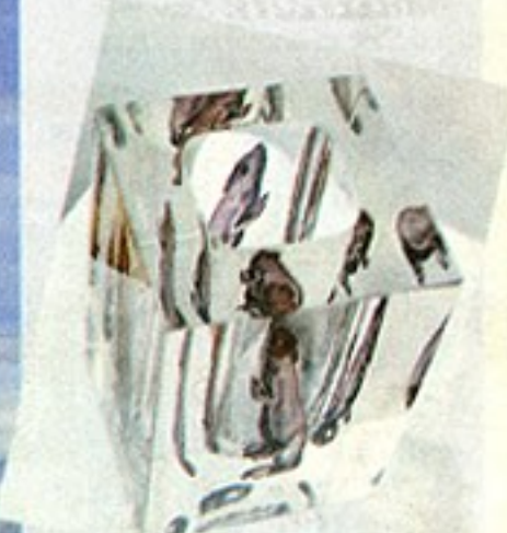
ØGLELIV: Cathrine Maske liker glassets mulighet til å skape illusjoner. Hvor mange fotografier av øglen tror du er kapslet inn i glasset?