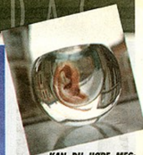
KAN DU HØRE MEG: «De fem sanser» het mastergraden til Cathrine Maske. Den uvanlige kombinasjonen av glass og fotografi slo an.