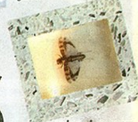
TRÅKK PÅ ET INSEKT: Insektene med vinger er sikret evig liv der de ligger innkapslet i terrazzogulvet i Sandvika kulturhus.

FUNKSJONALITET: Vekselvirkningen mellom rent kunstnerisk arbeid og oppdrag som Magnors nye vinservice «Cilla» er noe Cathrine liker godt. I glass-serien har hun lagt vekt på funksjonalitet og eleganse.