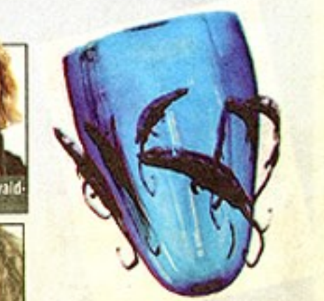
INNKJØPT: Glassorboidene pryder fire norske ambassader og er kjøpt inn av flere museer.